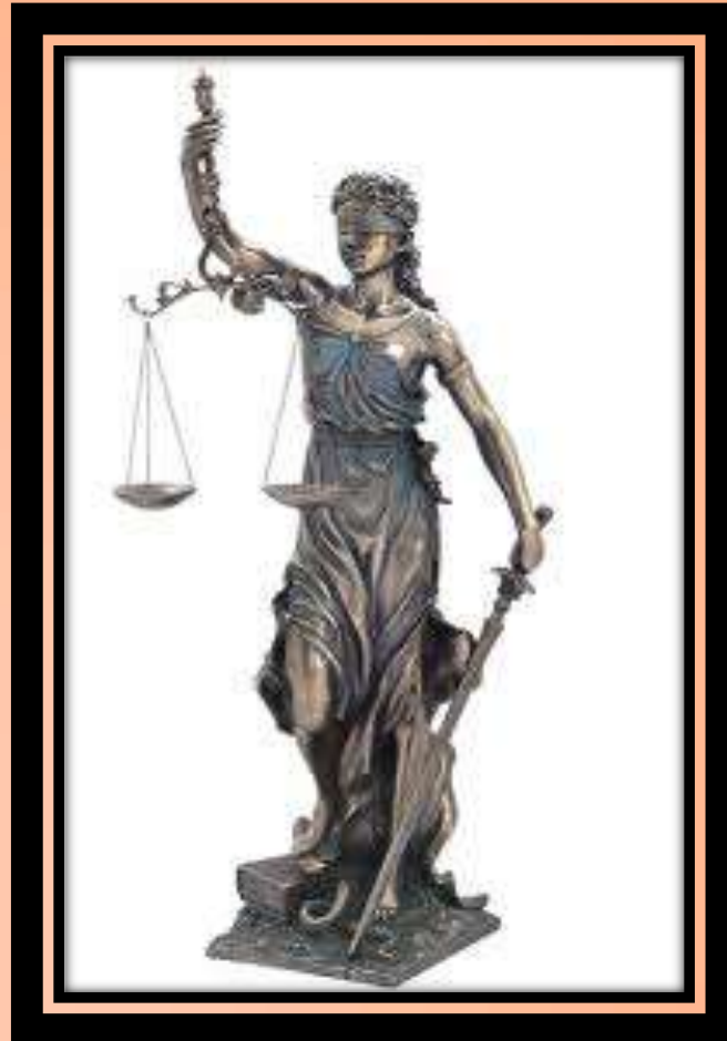
Figura que representa a la justicia