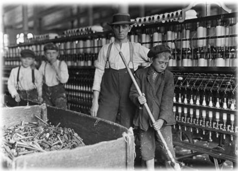
Niños trabajadores en una fabrica de algodón (EE:UU) 1911.

El trabajo se empieza a considerar como una mercancía que se vende por un salario.